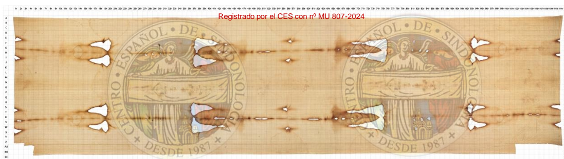
Figura 3. Anverso Síndone de Turín.