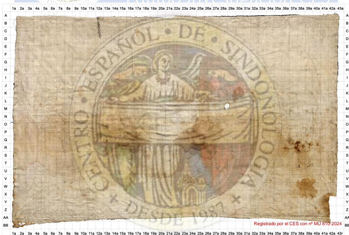
Figura 1. Anverso Soudarion de Oviedo.

Registrado por el CES con nº MU 810-2024