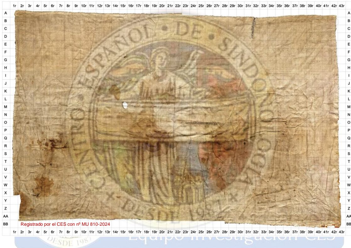
Figura 2. Reverso Soudarion de Oviedo.