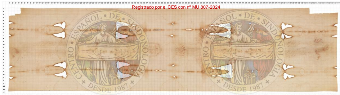
Figura 4. Reverso Síndone de Turín.